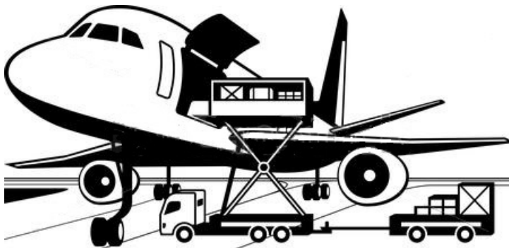
Chargeur K - Cargaison nécessitant un chargement à haute levée le long d'un aéronef

L'accès aux aéronefs peut se faire par des portes de chargement relativement petites situées sur le côté ou le nez de l'aéronef, bien que des aéronefs à chargement par la queue soient aussi exploités à partir d'aéroports commerciaux.